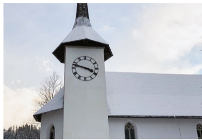
Kirche Eggiwil