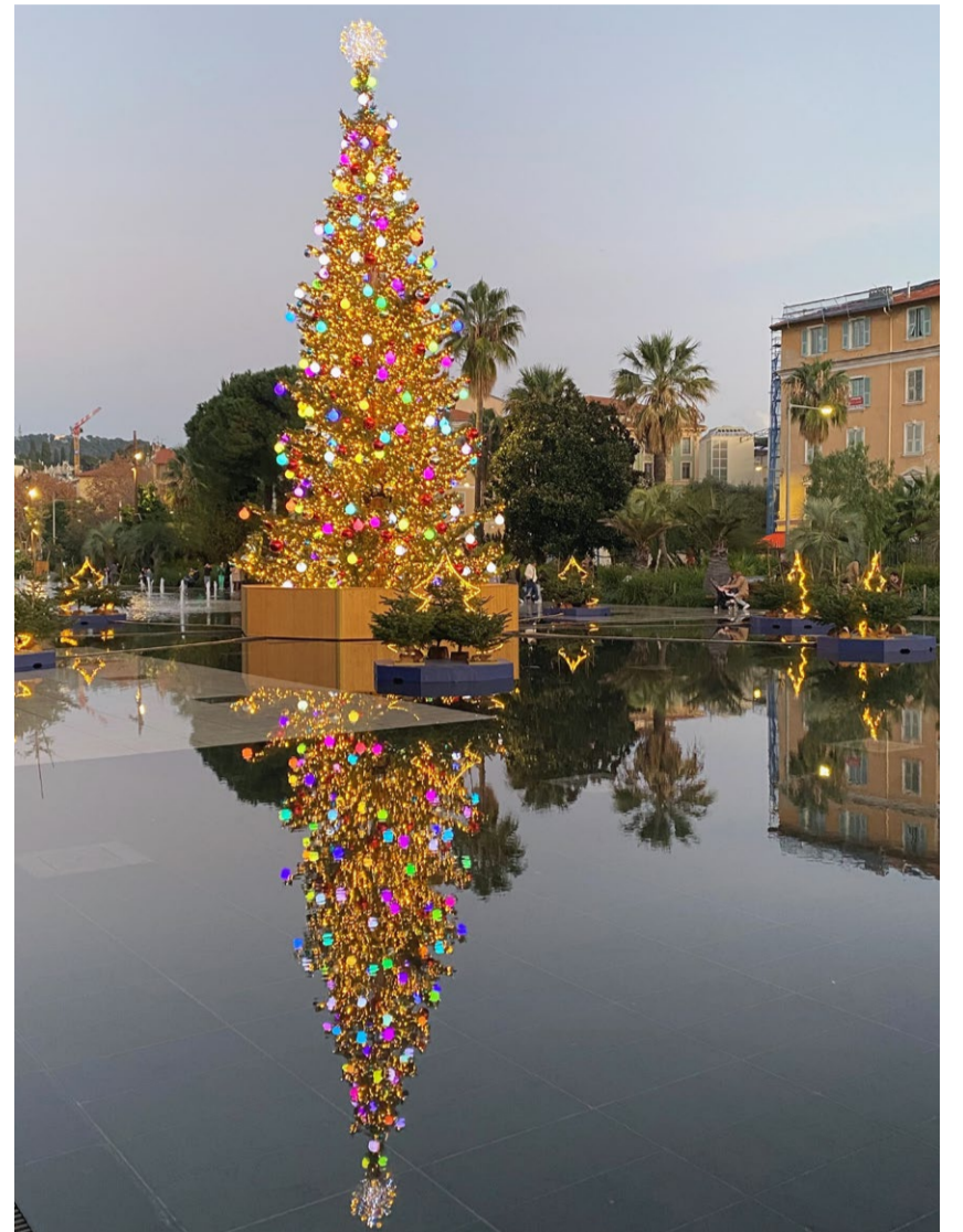
Weihnachtsbaum in Nizza (SK)