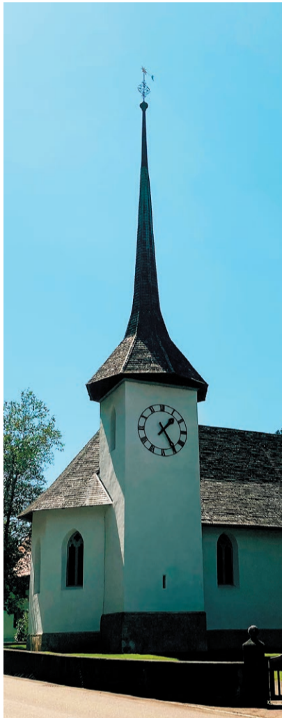
Kirche Eggiwil