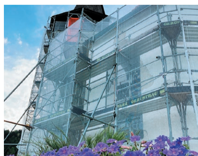
An unserer Kirche wird derzeit fleissig gearbeitet. Sei dies an der Restauration der Wappenscheiben, der Fensterrahmen oder an der Aussenfassade.