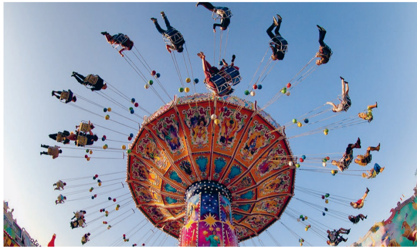
Das Leben drehte anders an diesem Tag...

Mia: Krass... Aber nochmals: wozu sollte das gut sein? Theo: Der Mensch kann ja nicht ununterbrochen arbeiten, er muss sich zwischen durch erholen. Mia: Schon, aber das kann ich auch, ich habe ja immer wieder mal einen halben oder einen ganzen Tag frei. Wie heute. Theo: Und deine Freundinnen und Freunde? Mia: Sie natürlich auch! Lena hat am Donnerstag frei, Max am nächsten Montag... wann es halt gerade passt! Theo: Aber dann könnt ihr euch ja gar nicht miteinander verabreden, wenn alle an einem anderen Tag frei haben! Mia: Ja, das tun wir auch selten. Wir treffen uns vor allem auf sozialen Plattformen, manchmal nachts, weil wir sonst keine freien Zeiten haben. Theo: Aber mit Urlaub, das ist doch nicht dasselbe! Mia: Schon, aber was können wir denn dagegen tun? Wir wollen doch eine erstklassige Ausbildung und einen Beruf, der uns erfüllt und Freude macht! Da liegt es nicht drin, dass an einem Tag alle die Beine hochlegen und nichts tun! Theo: Warum denn nicht? (gerät in Fahrt) Der Sonntag war der Tag, an dem die Familie etwas zusammen unternehmen konnte. Junge Leute haben am Samstag Party gemacht und oft die Nacht